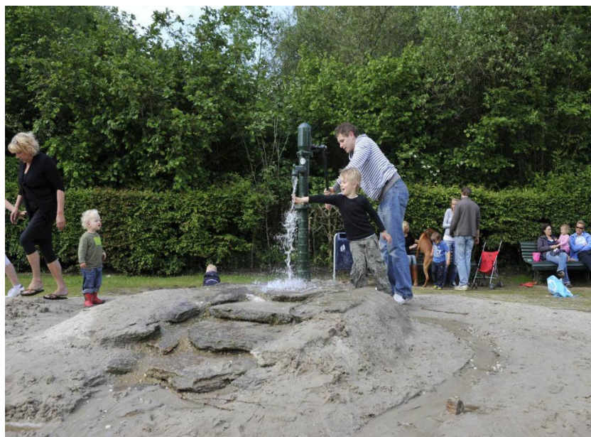
Voorbeeld van een natuurspeelplek

Bewoners willen meer betrokken worden bij het gebruik en de inrichting van de directe woonomgeving. De overheid speelt hierop in door verschillende vormen van participatie aan te bieden. Bewoners komen met wensen en ideeën en de gemeente faciliteert.