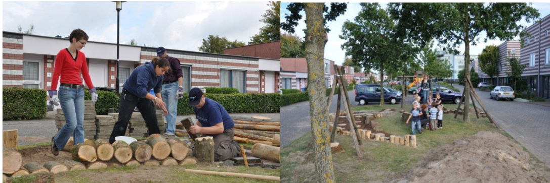
Voorbeeld: bewonersinitiatief speelplek in Hoogland

Bij het nemen van fysieke maatregelen in de openbare ruimte dient gekeken te worden naar de invloed hiervan op de speelbaarheid van de openbare ruimte.