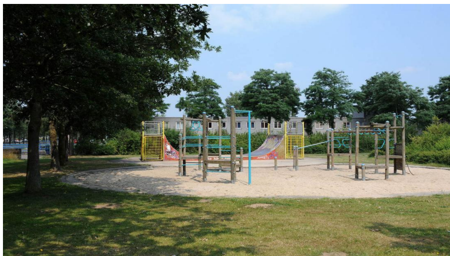
Voorbeeld van een formele speelplek

Amersfoort scoort hoog op het aantal sport- en speelvoorzieningen/locaties en de potentieel beschikbare speelruimte.